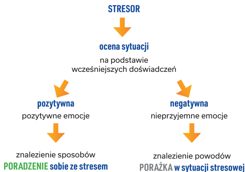
Ryc. 2. Interpretacja sytuacji stresowej 4

Jeśli nierealistyczne przekonania nie są Ci obce, postaraj się z nimi walczyć. Kiedy pojawiają się w Twojej głowie, powiedz swoim myślom: „STOP”. Staraj się też zastępować je myślami budującymi (patrz: tabela nr 2).